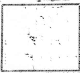
Đoàn Bô Tả... Hiệp Khắc Hành... (TIẾP THEO TRANG 1)