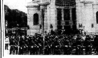
Quang cảnh trước trụ sở Quốc Hội Lần đầu tiên buổi lễ khai mạc sáng 27.9.

Quốc Hội Lần đầu tiên này quả thật là một niềm vinh dự của Dân Chủ mà toàn dân khao khát rất lâu, nhưng sự đi nhận diện bên lề nguyện vọng Dân Chủ thực tế như vậy là tương xứng, rằng nền dân chủ