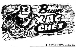
(56 23) ● XUÂN TÙNG THỰC TỊCH

Phí Kiên công Doãn thì phẩm ra khỏi nhà... Vô Trường công Tử... Hân Giang Nhân