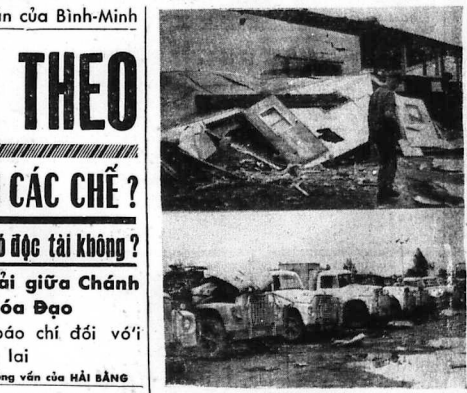
HÌNH TRÊN: Quang cảnh một mái của hàng bị sụp nhөр vì mìn của Việt Cộng. HÌNH DƯỚI: Quan cảnh máy dầy xe Cam-nhông bị Việt Cộng phá huỷ tại Huế.

Đáp câu hỏi của chúng tôi: «Thay vì của ông thì nội các chế độ Tổng thông chế lại hay ở những điều nào?» Ông Phan Khắc Sửu cho biết: «Là nay tôi đã dự thảo hiến pháp mới các chế độ, tôi dự định sẽ mang Hiến pháp ra trình bày với Quốc hội... sau chấp nhận thì xem...»