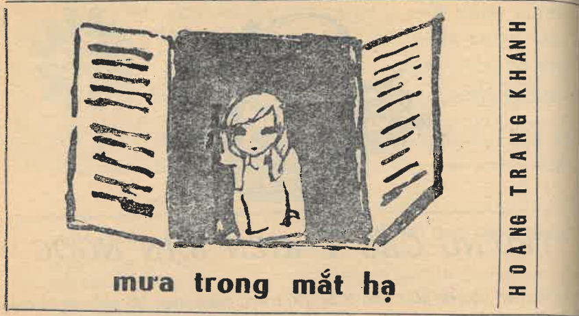
mưa trong mắt hạ