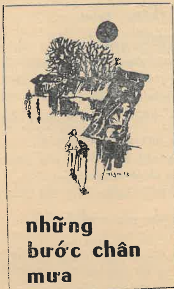
những bước chân mưa