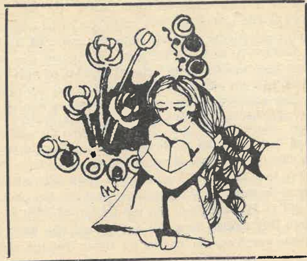
TRẦN THỊ GIA LAI