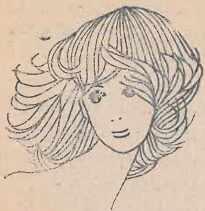
PHẠM PHỮ TRINH