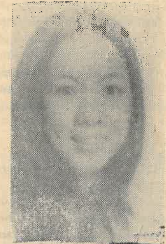
NGỌC THÂN ÁI 1972