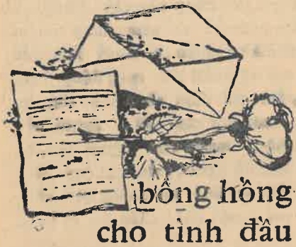
bông hồng cho tình đầu

« Nếu xa em, chắc sẽ vô cùng nhớ... » người nói với giọng ấm và trầm. Em cúi đầu thối khê « Em cũng