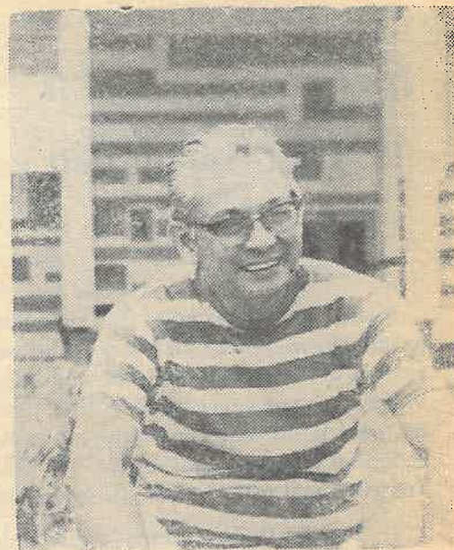
Phạm Duy, sức mấy họ giết nổi anh ?

Đi hỏi lòng người, lòng đời, sẽ nghe lòng người, lòng đời rung động vì nhạc Phạm Duy. Người thành phố năm nào nhớ chứ ? Lúc phá hết phố phường biệt ly đời gấm hoa, người vui đời áo nâu, quên hết u sầu ? Người đã về cùng dân tộc chưa quên thuở đứng bên kia theo giặc, một chiều nghe Phạm Duy nhắc nhở Anh ơi quay súng về ngay máu người dân Việt còn cần cho luống cày. Tôi mong từng phút từng giây sống chẳng oán thù để chờ anh tới đây. Trở về làng xưa để xem hoa bốn mùa nở trên xác quân thù... Ai đã xúc động Bà mẹ Gio Linh ? Ai đã cùng Phạm Duy : Quay súng giết quân thực dân, quay đầu grom giết quân tham tàn ? Ai đã theo Phạm Duy kháng chiến xa nhà nhip theo đời sống mới đều phải hiểu lúc đó cách mạng đẹp. Khi cách mạng đẹp, nghệ sĩ ca ngợi cách mạng. Nhưng khi cách mạng phai phất phấn son, nghệ sĩ có quyền bỏ cách mạng, có quyền dấn lên cách mạng mà đi. Và không thể nói là nghệ sĩ phản bội cách mạng. Cách mạng đánh lừa nghệ sĩ, lợi dụng nghệ sĩ. Những Văn Cao, Tô Vũ đã chết vì mê mải thứ cách mạng tả tơi. Phạm Duy không chết vì lìa bỏ cách mạng theo nghĩa của bọn giả hình thích làm ngự sử. Không có luật lệ bắt nghệ sĩ phải học tập tư tưởng, phải thu nguồn rung động vào một công thức, phải phục vụ cái này, hy sinh vì cái nọ. Phan Khôi đã anh dũng trả lời bọn văn nghệ giáo điều Hà Nội. Văn nghệ, theo Nhất Linh, phải muôn màu, muôn vẻ lại muôn hương , không bao giờ bị cấy xuống đất cần để chỉ nở toàn cục vụn thọt. Chúng ta chọn miền Nam là thoát khỏi giáo điều sáng tác, xa hẳn bọn