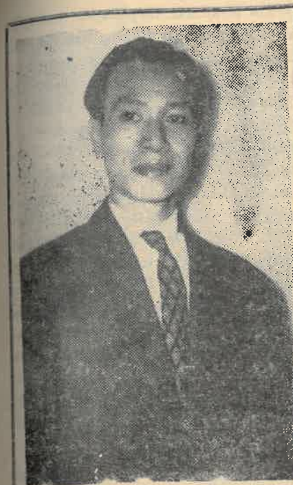
QUÁCH ĐÀM (1923 — 1971)