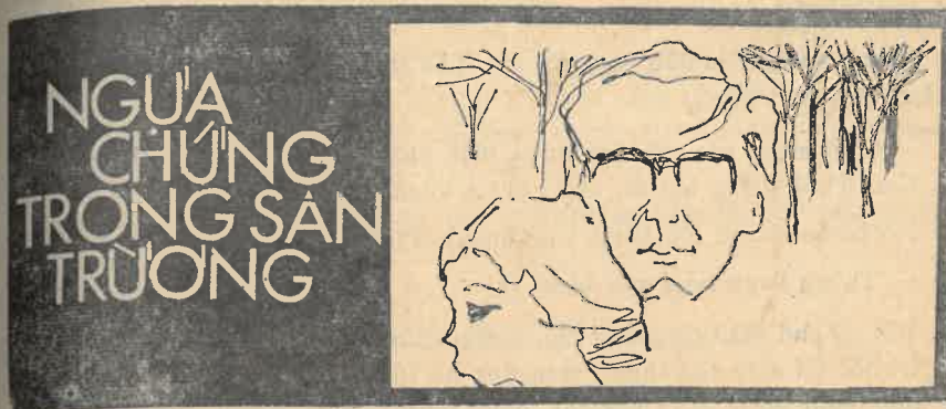
truyện dài VŨ MỘNG LONG

— Tượng Thần Tự Do trị giá 600.000 Mỹ kim theo giá tiền đương thời