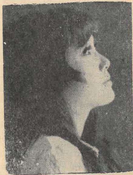
Nàng đang ru ngủ chúng ta...

vẫn không đủ can đảm xem «tài tử» Thanh Lan, giọng hát ru tôi ngủ hồn nhiên, múa may cạnh những hoa hèn, cỏ dại. Đọc báo, nghe cô than phiền chuyện đóng phim, thấy cô trách móc đạo diễn đã lợi dụng sự dễ dãi của cô, tôi thương Audrey Hepburn của tôi quá. Cô đã không gặp chàng ký giả cao thượng Gregory Peck. Không, điện ảnh không xấu xa, chỉ mong cô chọn phim, chọn đạo diễn, chọn tài tử đồng diễn nếu cô muốn nổi tiếng với nghệ thuật thứ bảy. Cuối cùng, như Doris Day, cô vẫn về cùng âm nhạc. Cho mọi người được ngủ hồn nhiên bằng giọng hát của cô.