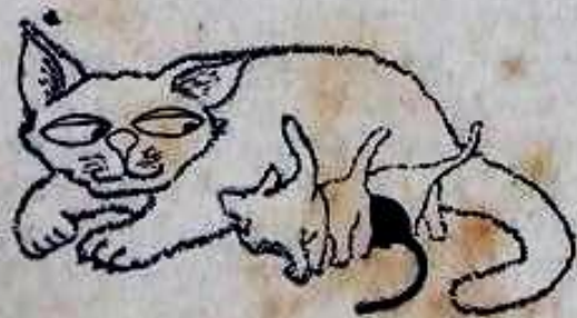
Tranh không lời

Ông to lớn làm tất cả các thực khách trong nhà hàng chú ý. Ông xô ghế đứng dậy sau khi để lại trên bàn 1 mẫu giấy nhỏ. Mọi người cùng xúm lại chỗ anh bồi. Mẫu giấy viết :