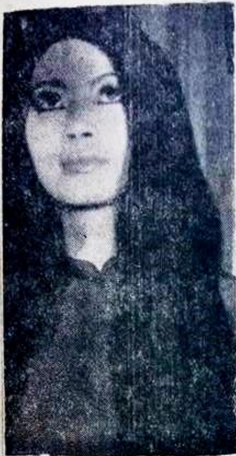
KHÁNH LY trên bãi cỏ ngày nào