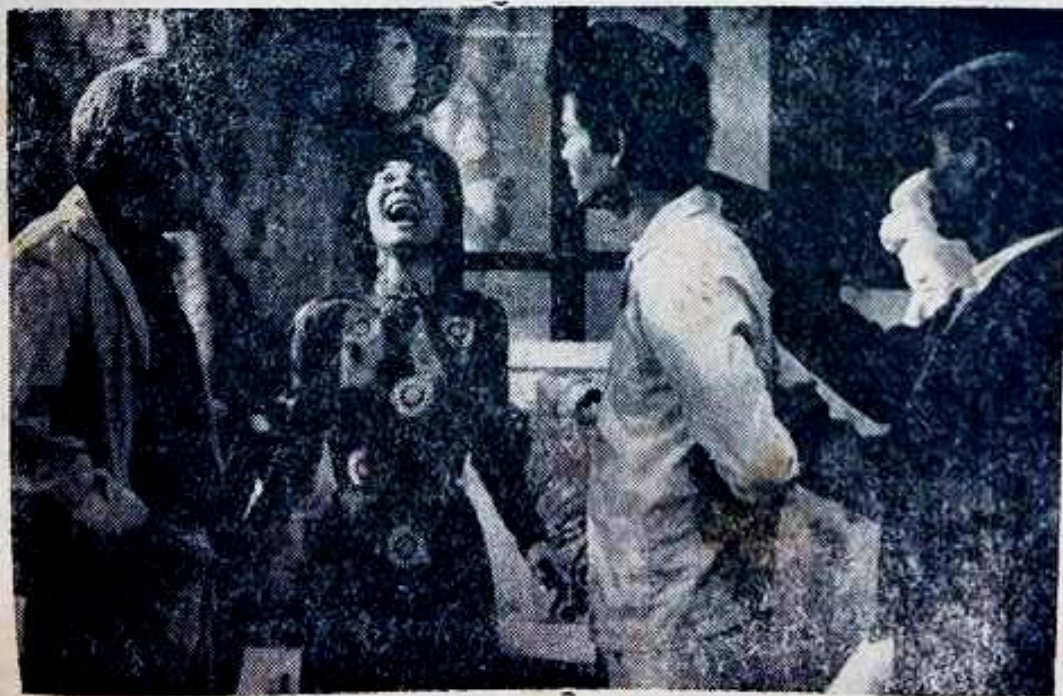
Cha con, người tình gặp gỡ vừa đau xót vừa buồn cười

SỰ TÀN ÁC, KHỐN NẠN ĐÃ BIẾN mất trên khuôn mặt lão Hanh. Lão nói về tình thương con. Thương con đến nỗi phải giết vợ và tình địch vì vợ và tình địch của lão đã hất hủi con lão trong thời gian lão phiêu bạt.