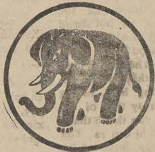
Nhãn Hiệu Con Voi

CẢM CÚM — SỐ MŨI — NHỨC ĐẦU — NHỨC RĂNG — ĐAU NHỨC BẮP THỊT HÃY UỐNG RHUMEX (Bán tại các nhà thuốc tây)