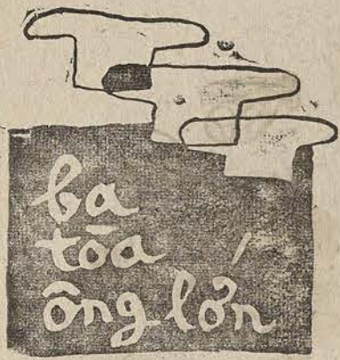
TIỂU NGỌC Người dân đen cầm cân