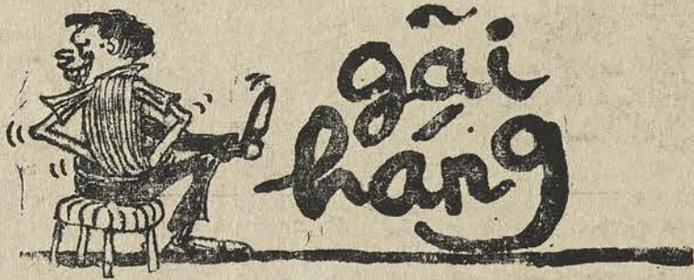
Ngồi rả gãi hàng giải lãn tẩn Trần Văn Hương

sách giúp Phế Binh và công cuộc xã hội Được lắm, những anh nhà giàu chuyên đầu cơ tích trữ bóp cổ dân nghèo có đi càng thêm nhẹ đưng quần. Như thế chẳng hơn tình trạng mập mờ trốn sâu lậu thuế hiện nay và nhà nước chẳng được đồng bạc nào. Vì cảm cơ bạc mồi dâm, các sông bạc và các tiệm bán thịt người vẫn đầy đầy hoạt động huỳnh huých; cảm nháy lăm, dân làng nhót vẫn khiêu vũ như già gạo tại các bar có chủ Đại Hàn và đặc biệt nhiều nơi bên Gia Định khéo chạy chọt cộn có mục «vũ con nhộng» nghĩa là nhảy ở trường để lá đa một đồng với đa số khách hàng người Việt. Chỉ có mấy chú Ba Chú Phi và những ông bạn Sâm Cao Ly trong khi chủ nhân người Việt làm ăn khó khăn cười tươi như mếu, một số phụ nữ vì sinh kế đã phải ngã vào tay ngoại nhân để dâng đề rượu đồng VN bị cày bừa nát bấy.