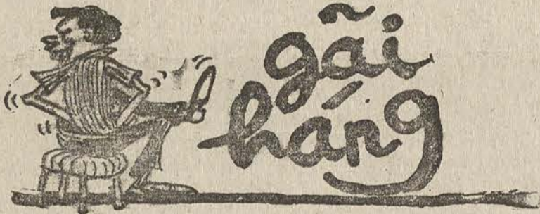
Ngồi rù gãi hăng dài tăn tăn

phương có thể bị Ủy Ban An Ninh hỏi thăm sức khỏe? Các cụ trong dân nghị sao về mạng sống của Ủy Ban An Ninh, về việc tạo ra một bầu không khí thực sự tự do cho nền đệ nhị cộng hòa Annamta ?