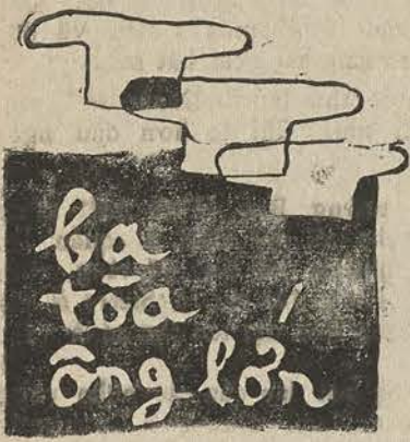
TIÊU NGỌC Người dân đen cầm cân