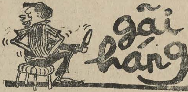
Ngồi rù gãi hàng giải lẩn tẩn Trần Văn Hương

Tất nhiên, nếu các Tướng tham nhũng thật mà Tổng Thống lại danh dự ra mà bảo đảm, thì Tổng Thống sẽ lãnh tù.