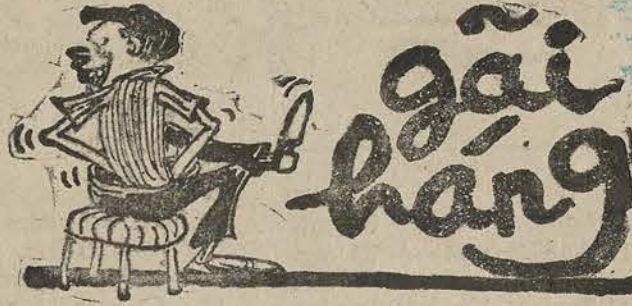
Ngồi rà gãi hăng giải lộn lộn Trần Văn Hương

Đây là một vấn đề rất quan trọng, chánh quyền không thể đứng ngoài phó mặc cho tư nhân một cách vô trách nhiệm. Vì hiện nay, trường tư đông gần gấp hai lần trường công, và việc tăng thù lao giáo chức có ảnh hưởng trực tiếp tới việc giáo dục cả một thế hệ.