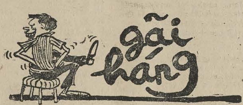
Ngồi rù, gãi hàng giái lẫn tên Trần Văn Hương

Nhà nước ta vốn tốt bụng chẳng hiểu tốt bụng thật hay vì sự ngu si, đã lần lượt quảng hoa cho Trương Đình Dzu, Cho Trần Ngọc Châu. Hoa bây giờ mắc lắm, không nên quảng vung vít như vậy.