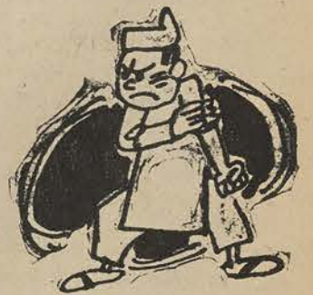
CON ONG TRANG 4

việc hợp lý, nhưng không thể chỉ đá đít chúng rồi thôi. Dân chúng không hài lòng. Khi thấy bọn ma đầu chỉ bị đuổi đi mà không bị trừng phạt. Dân chúng đòi hỏi chính quyền phải mở cuộc điều tra và đưa chúng ra trước pháp luật trả lời về những vụ tham nhũng, đục khoét lên đến bạc tỷ của chúng. Nếu bọn ăn cắp của công chỉ bị đuổi ra khỏi công sở sau khi chúng đã ăn cắp no nê, không bị trừng phạt, thì chúng quá sướng. Đệ Nhị Cộng Hòa vẫn lớn tiếng la lối tận diệt tham nhũng... Toàn dân chờ đợi các nhà lãnh đạo quên hiềm khích cá nhân và làm một hành động mạnh tay với bọn ma đầu Nhà Đèn cho dân nghèo được mát dạ.