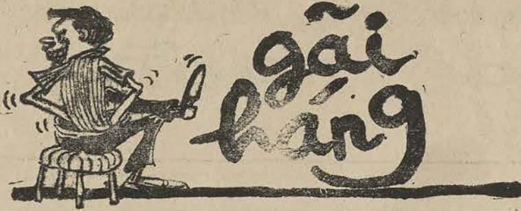
Ngồi rù gãi hăng giải lẩn tẩn Trần Văn Hương