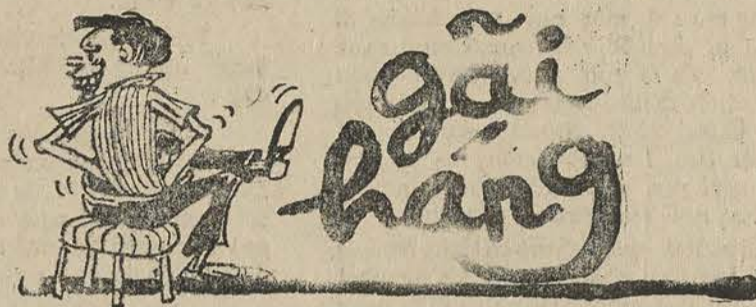
Ngồi rù gái háng dài lần lần Thơ Trần Văn Hương

Chẳng hạn chuyện Thương Phế Binh và SVHS. Ông Phó muốn giải quyết ngay, trong khi ông Chánh cứ «y» ra đây.