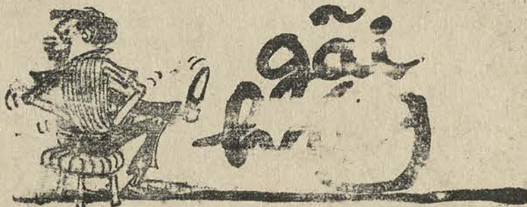
« Ngồi rù gai háng dài lần lần » (Thơ Trần Văn Hương)