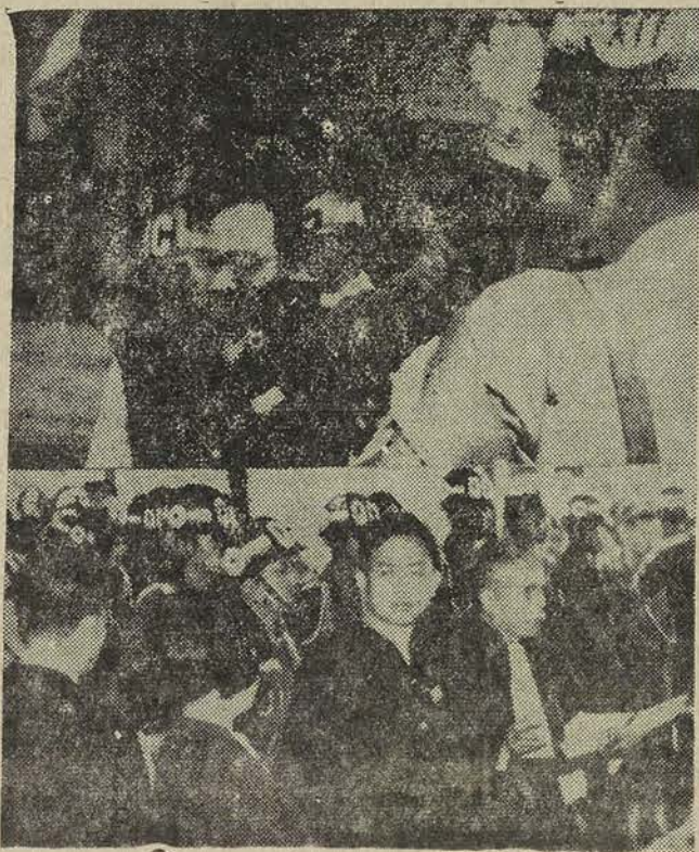
Đ! B Trần ngọc Châu trước Tòa án Mặt Trận

Báo chí đã tranh đấu đòi giá giấy báo đừng có tăng đồng thời, đòi bưng luôn cả tổng trưởng Phạm Kim Ngọc. Cuộc tranh đấu quyết liệt tới cái độ sắp tuyệt thực sau khi đã cạo trọc đầu.