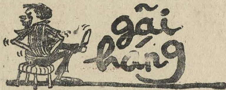
« Ngồi buồn gãi hăng dài lân tẩn »

Rút cuộc câu « thùng rỗng kêu to » vẫn đúng, và những anh cứ hay vô ngược bảo rằng mình không hèn, thì chính là người hèn vậy.