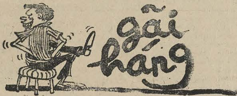
«Ngồi rù gãi háng dái lùn tùn» (thơ TRẦN VĂN HƯƠNG)

Nhưng mà... mẹ kiếp! Lưu xá thì xấu lắm.