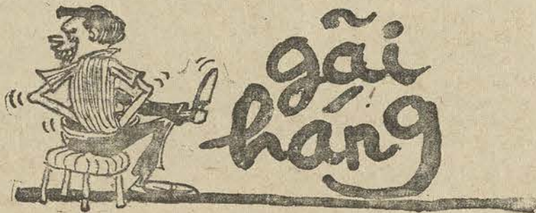
«Ngồi rù gãi háng dái lán tấp» (thơ TRẦN VĂN HƯƠNG)

Ông Dân biểu vẫn tự gán cho mình tâm nhân hiệu "Người Việt cô đơn". Cả làng người ta tăng giá, trong khi ông dân biểu xé rào, đúng là "Người Việt cô đơn" mẹ kiếp! Làng báo bần thậ!