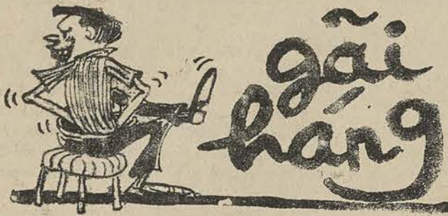
«Ngồi rừ gãi hăng dái lẩn tẩn» (thơ TRẦN VĂN HƯƠNG)

● Cần tìm hiểu ngay sự thực : Quả thật có dân biểu Cộng sản hay hành pháp «chụp... mũ» lập pháp ?