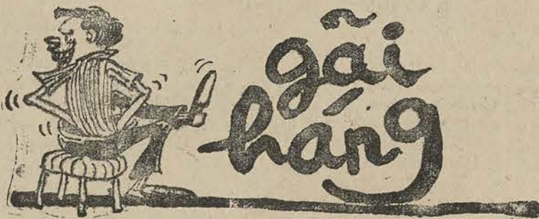
«Ngồi rừ gãi hăng dái lẩn tẩn» (thơ TRẦN VĂN HƯƠNG)