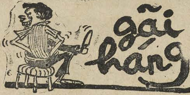
«Ngồi rừ gãi háng dái lán tẩn» (thơ TRẦN VĂN HƯƠNG)