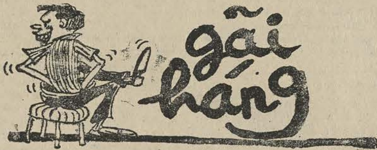
«Ngồi rù gãi háng dái lẩn tẩn» (thơ TRẦN VĂN HƯƠNG)