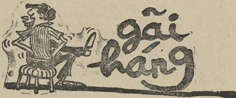
«Ngồi rừ gãi hăng đái lẩn tẩn» (thơ TRẦN VĂN HƯƠNG)