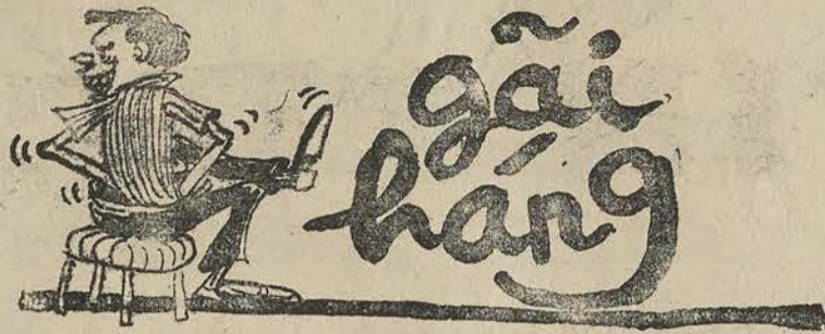
"Ngồi buồn gãi hàng dãi lẩn tẩn" (trích lao trung lãnh vận)

Chủ Nhiệm Bộ biên tập và anh em ấn công CÓN ONG