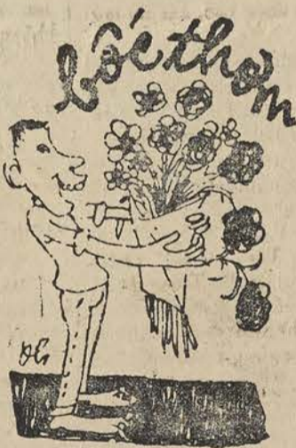
Bức thư không bức thối Bố đưa nào nói dối

một đường lối mới, theo đó, Cộng Sản thế nào cũng bị ghề gãy mất vài cái răng. Tuy nhiên dù gãy răng, CS cũng sẽ phải nước vô chữ dềch dâm nhò ra.