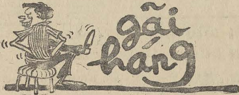
"Ngồi buồn gửi hàng dái lán tẩn" (trích lao trung lãnh vận)

Bản sau, trước khi ra thông cáo, nếu thiếu cố vấn pháp luật Bộ Kinh Tế có thể tới thỉnh ý cô Thập Thành trong ban biên tập Con Ong, cam đoan sẽ khéo hơn.