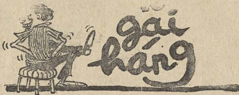
"Ngồi buồn gai hạng dái lẩn tẩn (trích lao trung lãnh vận)"