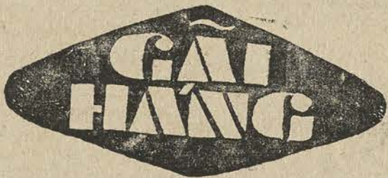
«Ngồi buồn gai háng dái lẩn tẩn» (trích lao trung lãnh vận)

Cửa chiều hồi sẵn sàng mở rộng cho quý vị làm đường ăn năn.