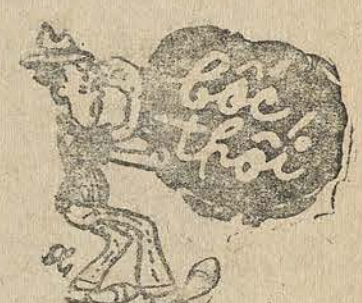
Người quân tử bit mũi mà đọc

người được mời đi trên chiếc xe ăn cắp, chẳng may thầy cò bắt được thế là về bóp năm ít bữa. Đợi đến khi rõ trắng đen, thì cũng «rạc» ra rồi. Vì vậy, các bà bác cô, những người rất khoái được mời đi xe bốn bánh, hãy coi chừng. Nếu được mời đi Toyota, thì tốt nhất, cứ tạm coi là xe ăn cắp, và từ chối gấp. Đừng có hám lấy le, xông xộc vác xác lên Toyota, thế nào cũng có ngày đi tù oan.