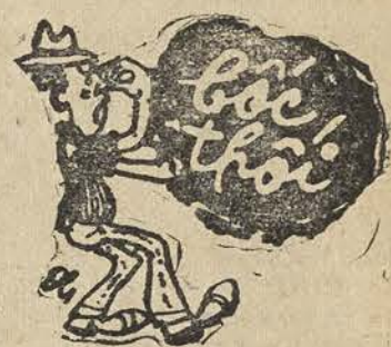
Người quân tử bịt mũi mà đọc