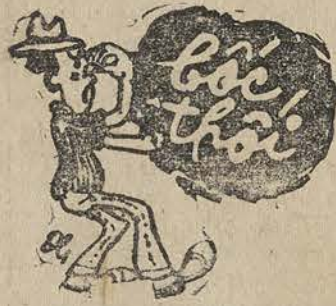
Người quân tử bịt mũi mà đọc