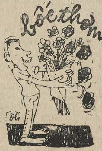
Chỉ bốc thơm Không bốc thối Bỏ đ'ira nào nói dối

Đàn Kiên Giang bảo đường tốt, gạo ế, nhưng các ông đểch cho phép chở về Thủ Đức. Các ông chỉ cấp giấy phép chở gạo cho B. (tai) thôi. Các ông có trách nhiệm về kinh tế có đáng bị màn thịt không?