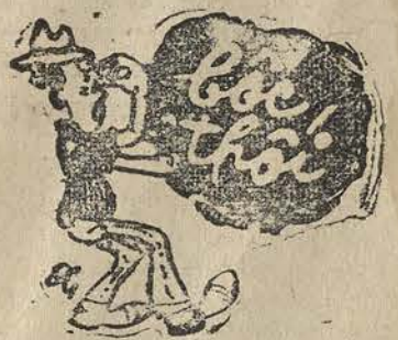
Người quân tử bị mũi mà đợc

Ồi! người Mỹ đòi làm áp lực với ta, chửi bới ta chưa đủ. Bây giờ còn định bắt ta sửa cả hiến pháp nữa. Nhưng thôi, không thêm nói nữa. Đụng đến lông chân các ông, có thể bị kết tội phá hoại tình thân hữu Việt Mỹ. Chỉ có các ông có quyền phá tội tôi. Còn tội tôi dèch được đụng đến các ông! Các ông bảo Thủ Đô Saigon là cái ổ điếm. Báo các ông chửi cả nước tôi tham nhũng, chửi quân đội chúng tôi nhất hủ thò dè, kết tội chính phủ nước tôi chưa được toàn dân triệt để ủng hộ. Nhưng có cho kẹo, chúng tôi cũng dèch dăm chửi các ông, mong các ông hiểu cho.