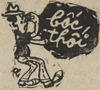
Người quân tử bịt mũi mà đọc

Ngoài ra, còn cái truyền thống cao đẹp là khi về nhà, thường bới móc, chửi bới lẫn nhau rất là bần. Vậy thì, xin hãy bắt chước ông xếp chạy bộ. Lãnh vực nào cũng vậy, phải biết mình biết người.