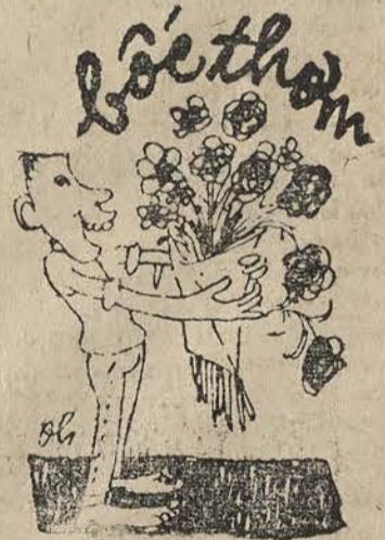
Chỉ bốc thơm Không bốc thổi Bổ đĩa nào nói dối

Nay nếu luật bắt ít nhất phải có 5000 đảng viên mới được coi là đảng, thì mớ đầu ra đảng viên. Vì thế, có nhiều đảng đang xoay tiền mua đảng viên. Hình như trong số đó có cả đảng Tân Đại Cổ Vít. Phen này khởi thẳng phát tài. Cũng khởi thẳng đau hơn hoạn. Vì không kiếm nổi số tối thiểu đảng viên pháp định, thì ngôi lãnh tụ bị hạ bệ. Mà mất ngôi lãnh tụ thì từ nay về sau, lấy tư cách gì mà ăn có.