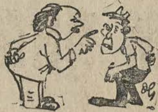
Tiền lời đó ở đâu mà ra? tất nhiên là đóp của khách hàng. Lời mỗi ngày gần bạc triệu. thá

Theo một tiết lộ của Ban Đại Diện công nhân E-Giao Chi mới cho biết, thì trong mấy năm qua, nhờ ba thằng Việt Cộng ác ôn khốn lịn chịu khó giặt mìn phá đường, khiến E-Giao Chi lời kinh khủng. Năm 1955 lời 49 triệu. Năm 1966 lời 120 triệu. Năm 1967 lời 124 triệu (một trăm hai mươi bốn triệu). Cứ theo cái đà mức lời leo thang kể trên, năm 1968 dăm lời tới 300 triệu Nghĩa là mỗi ngày lời gần một triệu.