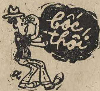
Người quân tử bị mũi mà đọc

Nhưng nói thì dễ, mà làm thì khó. Bởi chung những cây leo có bao giờ chịu đồng ý tách khỏi cây chính?