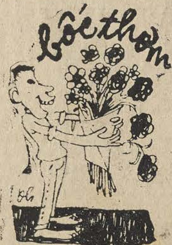
Chỉ bốc thơm Không bốc thối