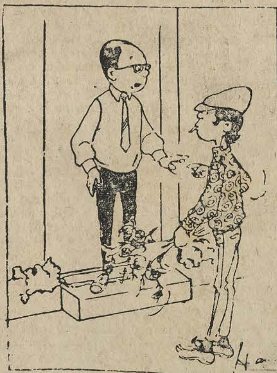
con ong trang 5

Con cái của những người Mỹ chết vì Việt Nam thì ai nuôi?