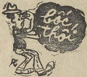
Người quân tử bịt mũi mà đọc

Hôm rồi, một nhật báo ở Thủ Đức đăng tin và hình ảnh về một cuộc biểu tình đả bảo Cộng Sản, ủng hộ Quốc Gia, của các sinh viên và Việt kiều ở Pháp. Tờ báo này đặt câu hỏi rằng tại sao những hình ảnh và tin tức quý giá đó không được phổ biến rộng rãi, mà bị « im » đi?