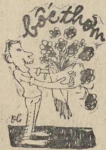
Chỉ bốc thơn Không bốc thối Bổ đũa nào nói dối