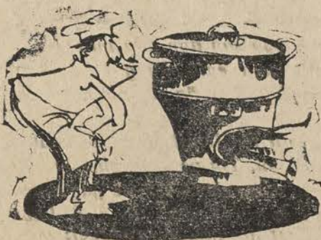
CUỘC BỐI CHẤT CHẢO NỒI