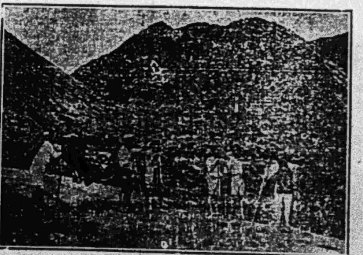
Một dãy núi đất ở Hoành-Tân

Bồi tàu không coi hoa cúc là hoa cúc, hoa đào là hoa đào, hoa mai là hoa mai, hoa hướng dương là hoa hướng dương, mà lại coi các thứ hoa ấy cũng các thứ hoa khác mà mình không biết tên được.