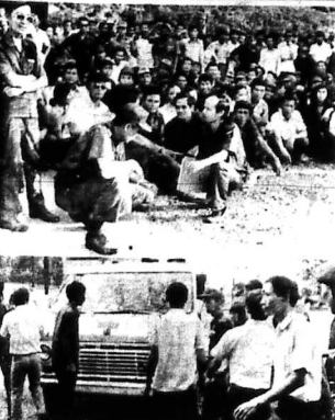
Công nhân các dân sở Mỹ họp đồng đạo tại Trại Cải Cách... Các công nhân không chỉ là lực lượng lao động mà còn là những người có tư tưởng tiến bộ...