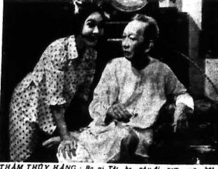
Caption text for the photograph.