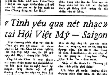
Caption text for the photograph.