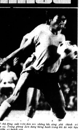
HTVN chủ động mời các cầu thủ về đội tuyển bóng đá quốc gia để huấn luyện.