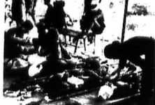
SAIGON 10-12 (ST). Hai người anh ngày 90 19 S.H. Nhạc từ từ tới thì Chương Thiên - Pháo kích