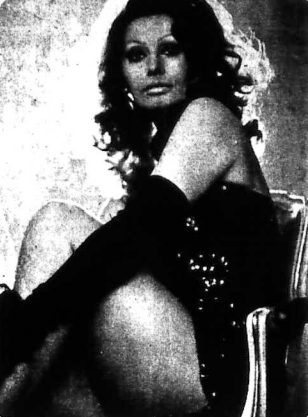
Sophia Loren: Một người đam mê!

Nhà văn Ý Sophia Loren... Một người đam mê!